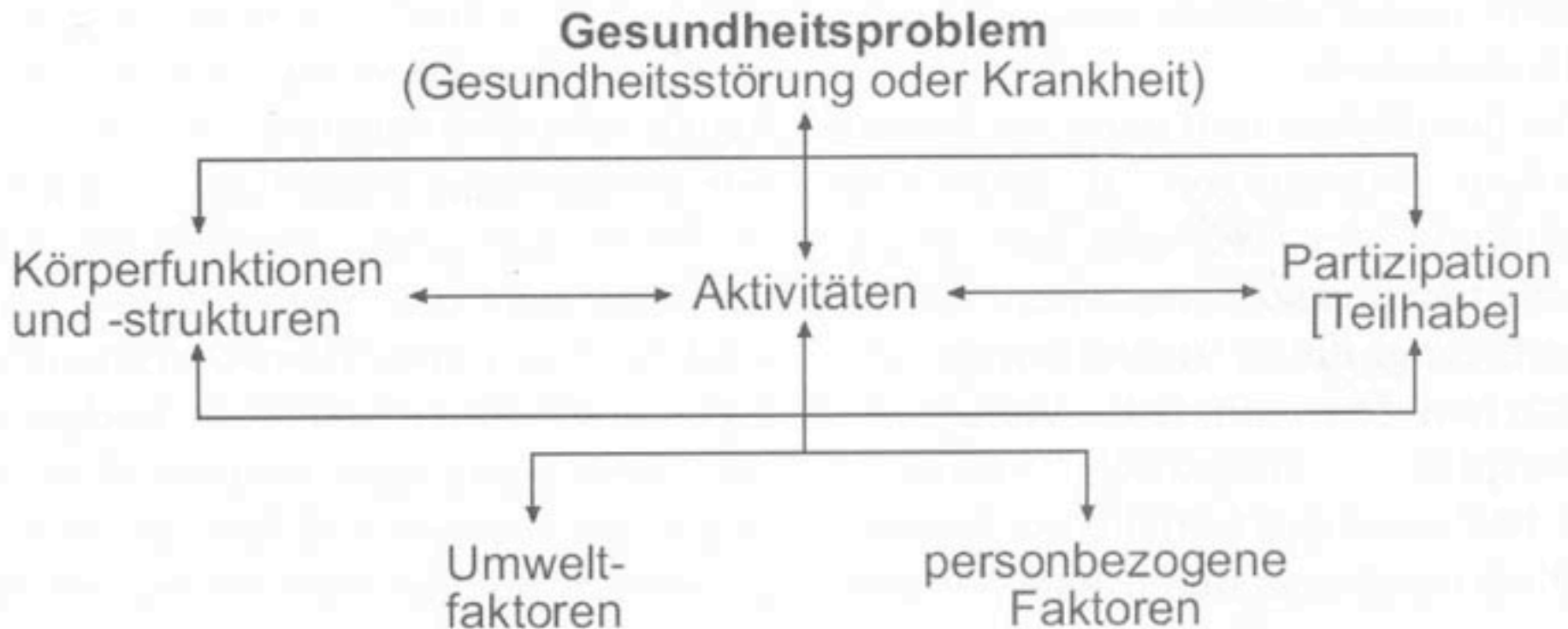
Abbildung 1: Komponenten der ICF

“Behindert ist man nicht, behindert wird man!”